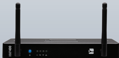
HMP400W avec wifi